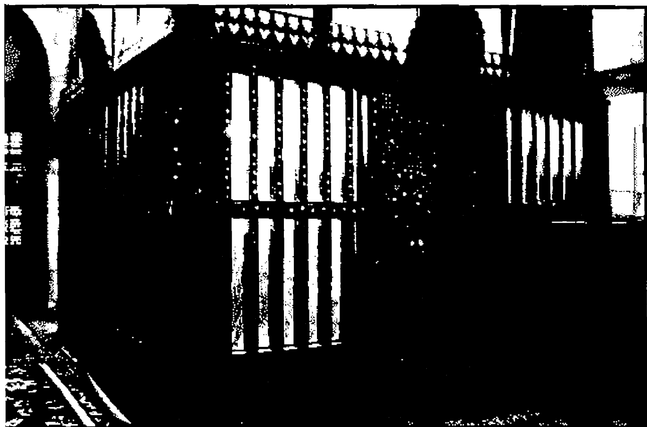
ضريح العارف بالله تعالى سيدى عبد الوهاب الشعرانى